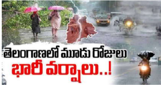
తెలంగాణలో మూడు రోజులు భారీ వర్షాలు..!

హైదరాబాద్: తెలంగాణ కెరటం: రాష్ట్రంలో రానున్న 3 రోజుల పాటు తేలికపాటి నుంచి మోస్తరు వర్షాలు కురవనున్నాయని వాతావరణశాఖ అధికారులు తెలిపారు. శుక్రవారం ఉమ్మడి ఆదిలాబాద్, నిజామాబాద్, నంగారెడ్డి, మెదక్ జిల్లాల్లో వర్షం కురిసే అవకాశం ఉంది. శనివారం ఉమ్మడి ఆదిలాబాద్, నిజామాబాద్, మెదక్, జగిత్యాల, సిరిసిల్ల, జనగామ జిల్లాల్లో వర్షం వడీ అవకాశముంది. ఆదివారం ఉమ్మడి ఆదిలాబాద్, నిజామాబాద్, మెదక్, జగిత్యాల, సిరిసిల్ల, భూపాలపల్లి, ములుగు, భద్రాద్రి, జనగామ జిల్లాల్లో వర్షం కురిసే అవకాశం ఉందని అధికారులు పేర్కొన్నారు.